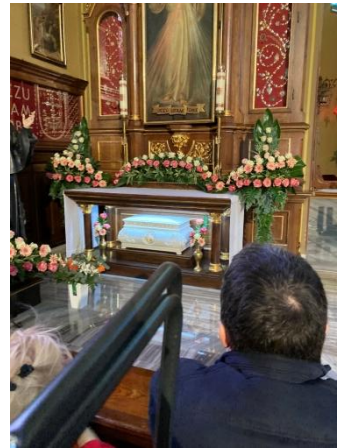
L'autel du sanctuaire de la « divine Miséricorde »--- Et les reliques de sainte Faustine.

Après la messe, qui a duré quelques deux heures, nous avons visité, grâce à la gentillesse d'une sœur qui nous a fait passer devant une foule de fidèles, les reliques de sainte Faustine. À la messe, de 10h30 à 12h 30, nous avons pu constater la ferveur des Polonais venus en grand nombre.