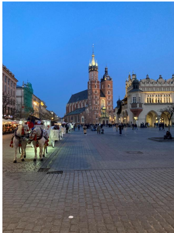
La grande place de Cracovie, la plus grande d'Europe, dicit les habitants.

Les deux vols, en attendant, qui nous ont amené du ciel de France à celui de Pologne, que nous avons traversé avec deux aéronefs, l'un venant de Nice et l'autre de Paris-Orly, sont tout deux arrivés en retard. Si bien que nous sommes parvenus à notre hôtel pour n'y dormir qu'à 3 heures du matin pour certains.