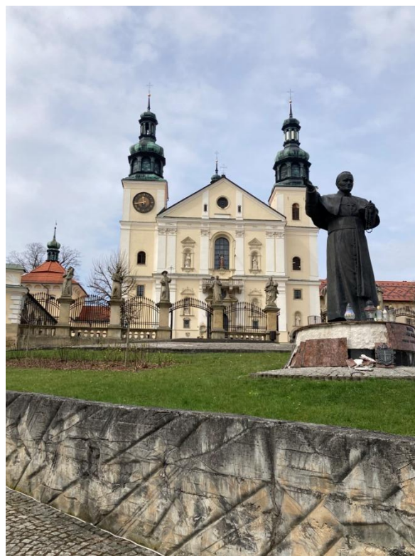
Le monastère de Kalwaria où JP2 s'est rendu plusieurs fois dans sa vie, avant et pendant son pontificat.

Nommé évêque auxiliaire, il se montrera, en tant que titulaire de l'épiscopat, combatif contre le communisme, notamment dans la construction d'une église à Nowa Huta, quartier de Cracovie, où nous nous sommes rendus. Il prend comme devise « Totus tuus » (tout à toi) inspirée de st Louis-Marie Grignion de Montfort, révélant un trait important de sa spiritualité, sa grande dévotion à la sainte Vierge.