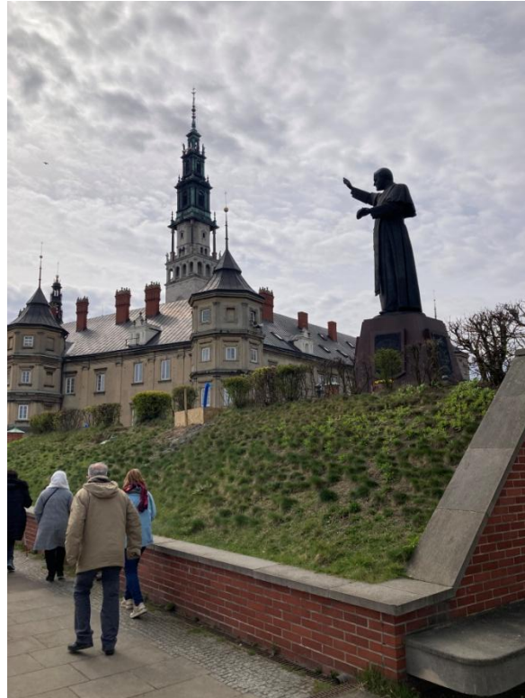
La citadelle de Jasna Gora avec une statue de saint Jean-Paul II.

suite, ont fait de celle-ci le cœur religieux de la Pologne et le symbole de sa liberté politique. Nous avons donc bien là, en cette ville de Czestochowa et de sa forteresse, la terre et le Ciel qui s'y rencontrent, puisque la Pologne y a été consacrée à Marie, la Mère de Dieu, en 1656. Nous avons visité la ville, qui est à environ 130 km de Cracovie, le troisième jour, soit le lundi 13 avril.