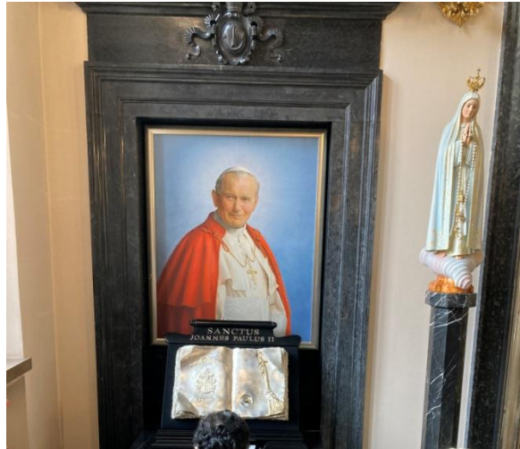
Chapelle du palais épiscopal de Cracovie, où Karol Wojtyła a officié.

Nommé évêque auxiliaire, il se montrera, en tant que titulaire de l'épiscopat, combatif contre le communisme, notamment dans la construction d'une église à Nowa Huta, quartier de Cracovie, où nous nous sommes rendus. Il prend comme devise « Totus tuus » (tout à toi) inspirée de st Louis-Marie Grignion de Montfort, révélant un trait important de sa spiritualité, sa grande dévotion à la sainte Vierge.