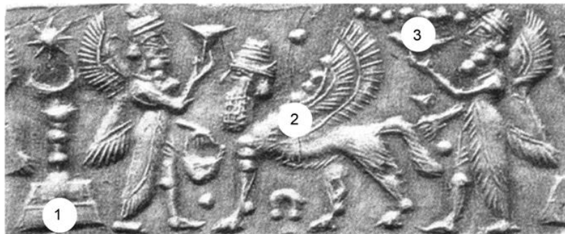
Fig. 1a. 1ère partie d'un sceau de la religion mandéenne. A gauche, cercle (1): les 3 boules avec au dessus un croissant de lune surmonté d'une étoile. Cercle (2): divinité ailée.

Par ailleurs on dit bien al Lah Akbar ce qui signifie al Lah est « plus grand que » (et non pas kabir , i.e grand , concède le) c'est-à-dire « Suprême ». Le dictionnaire nous dit que « suprême » signifie: qui est au dessus d'une hiérarchie qu'il domine en pouvoirs et prérogatives . Il y a donc notion de hiérarchie, donc de subordination ; toujours selon le dictionnaire, « Subalterne » signifie « qui est subordonné à quelqu'un, qui est hiérarchiquement inférieur, secondaire. » Donc al Lah est au dessus d'une hiérarchie de petites divinités subalternes ou secondaires dont al Lat , Manat et al Ozza escamotées dans la Ka'ba . Elles sont bien présentes, camouflées, sur les minarets des mosquées... sous forme des 3 boules (décoratives?) de grandeur décroissante, surmontées par le croissant de lune figurant le dieu Sin / Houbel . On retrouve ce dieu sur le sceau mandéen de Fig. 1a (cf. le cercle 1), et au-dessus du cercle 4 de Fig. 1b).